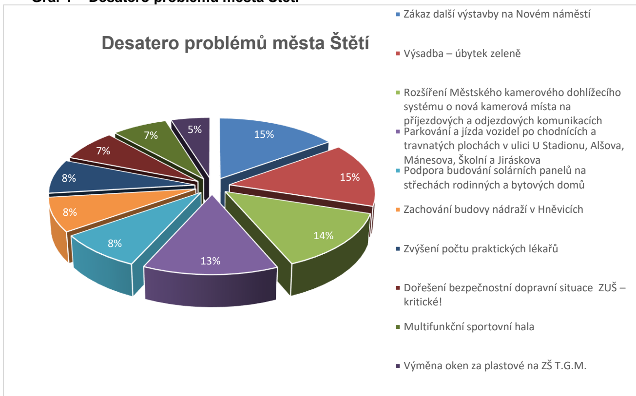
Graf 1 – Desatero problémů města Štětí