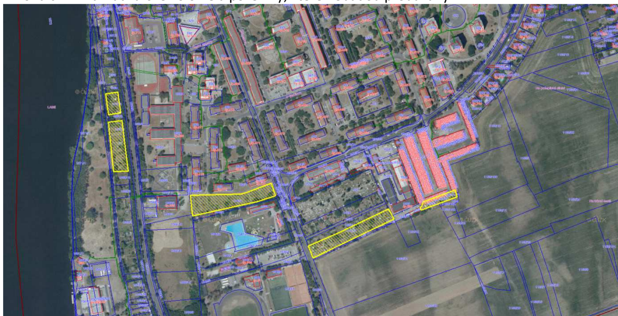
Příloha č. 1 – Zahrádkářské kolonie a pozemky, které nebudou prodávány